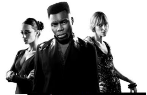
NITE / GUY WEIZMAN

Bram: "We zijn allemaal lost , tot aan de première. Dat hoort bij deze manier van theatermaken. We maken nou eenmaal geen simpele stukken met een duidelijk begin en eind, waarbij iedereen vanaf dag één precies weet wat er moet gebeuren. We zijn allemaal nauw bij het proces betrokken en er worden voortdurend nog dingen gewijzigd en geschraapt. Het is spannend, maar ook oneindig veel interessanter. Wat je moet doen is vertrouwen." ✖